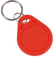
1 szt. z kompletu 50 szt. chipów SLZA 51R