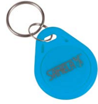
1 szt. z kompletu 50 szt. chipów SLZA 51B