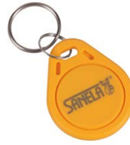
1 szt. z kompletu 50 szt. chipów SLZA 51